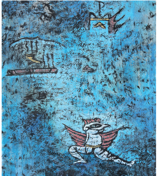
ZHANG Miao Harmonie : dialogue de signes 2015, encre et couleurs sur papier Prêt de l'artiste