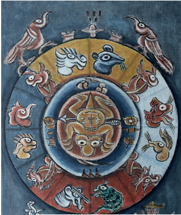
Diagramme de Bage 2019, encre et couleurs sur tissu en coton Prêt du China National Arts Fund, Lijiang © Lijiang Teachers College