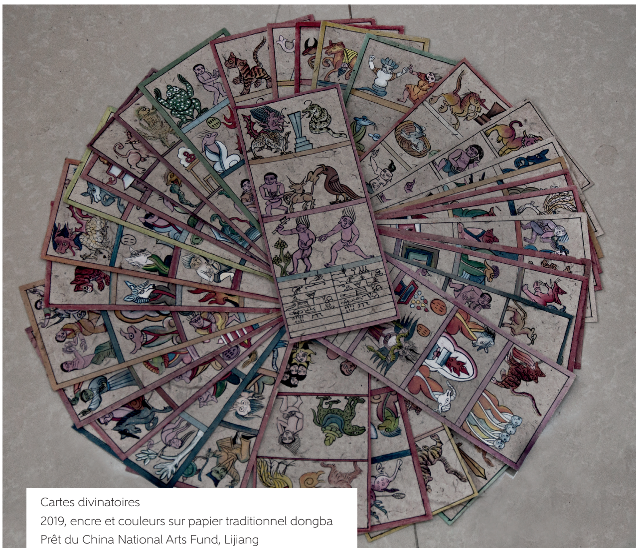
Cartes divinatoires 2019, encre et couleurs sur papier traditionnel dongba Prêt du China National Arts Fund, Lijiang