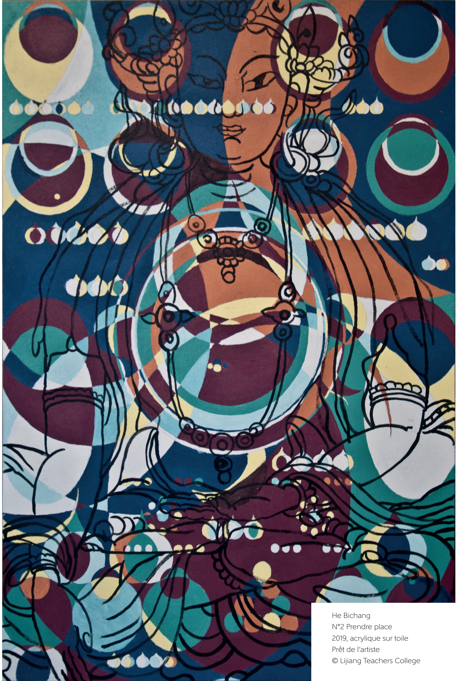
He Bichang N°2 Prendre place 2019, acrylique sur toile Prêt de l'artiste © Lijiang Teachers College