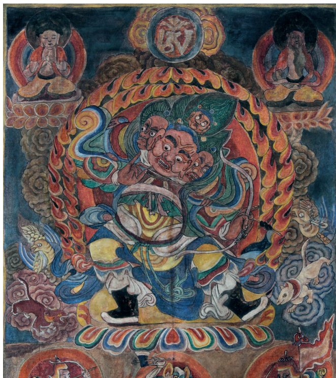
Karanniujiu 2019, encre et couleurs sur coton Prêt du China National Arts Fund, Lijiang © Lijiang Teachers College