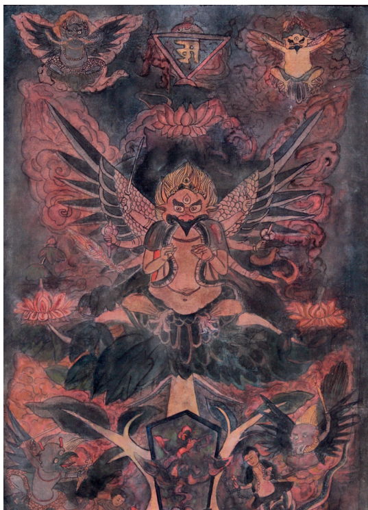
Duoqiongoubu 2019, encre et couleurs sur coton Prêt du China National Arts Fund, Lijiang